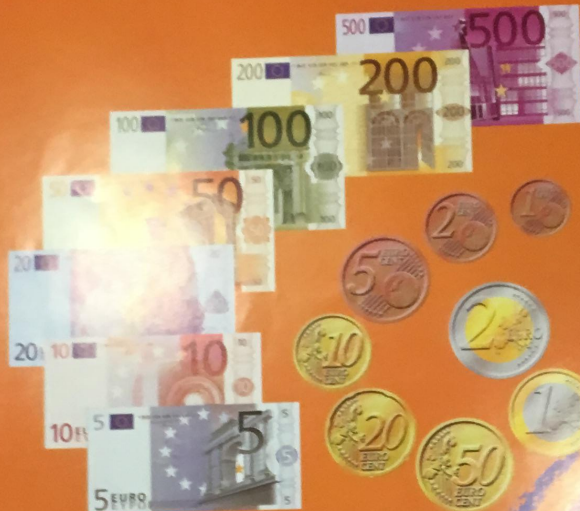
7 billets de banque, identiques pour tous les pays, de 5 à 500 euros illustrés par des ponts, portails et fenêtres en signe d'ouverture et 8 pièces de monnaie de 1 «cent» -soit 1/100 d'euro- à 2 euros avec une face commune et une face nationale.

Préparé par le Comité français pour l'euro