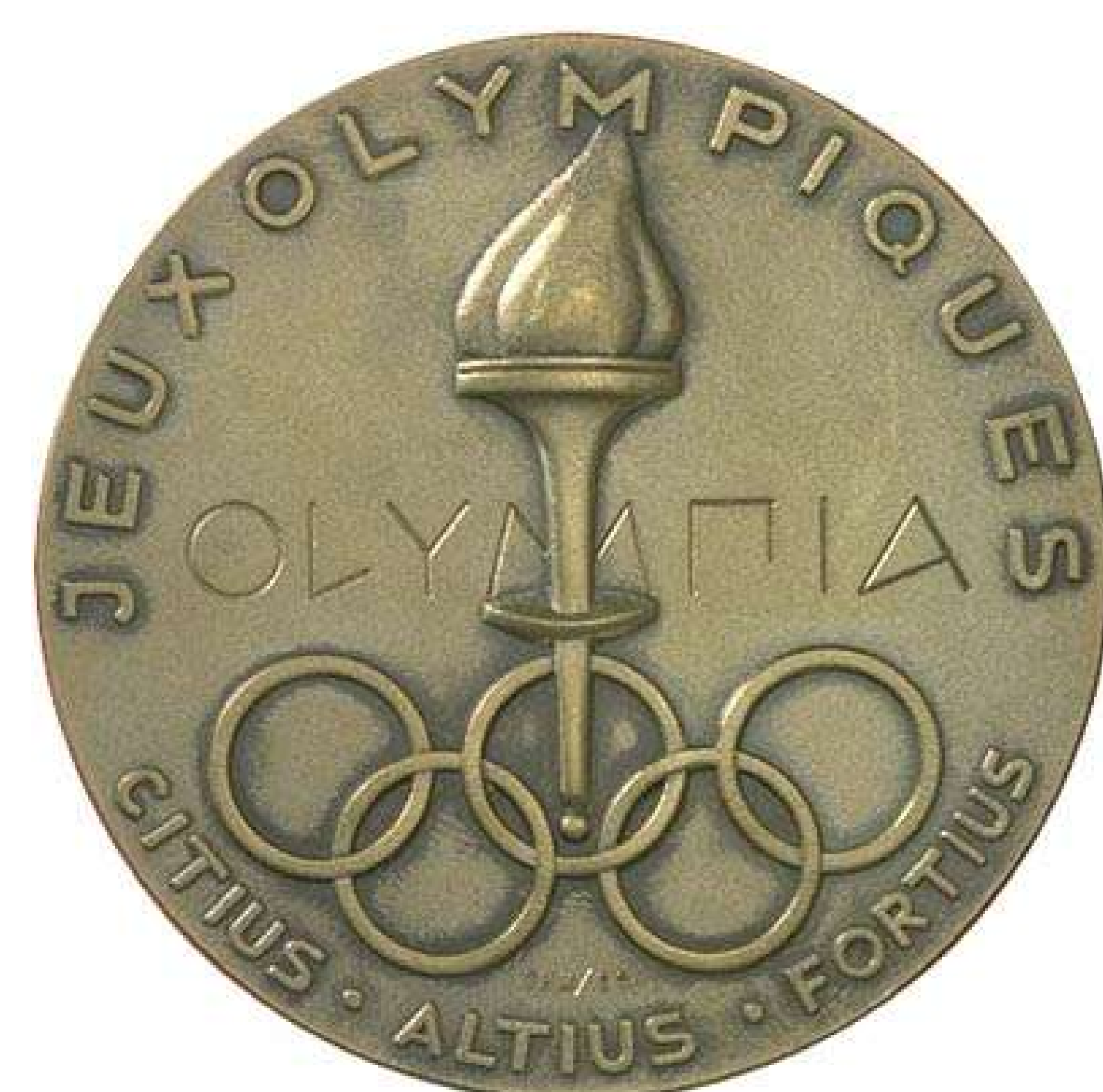
médaille des JO de 1952 à Oslo