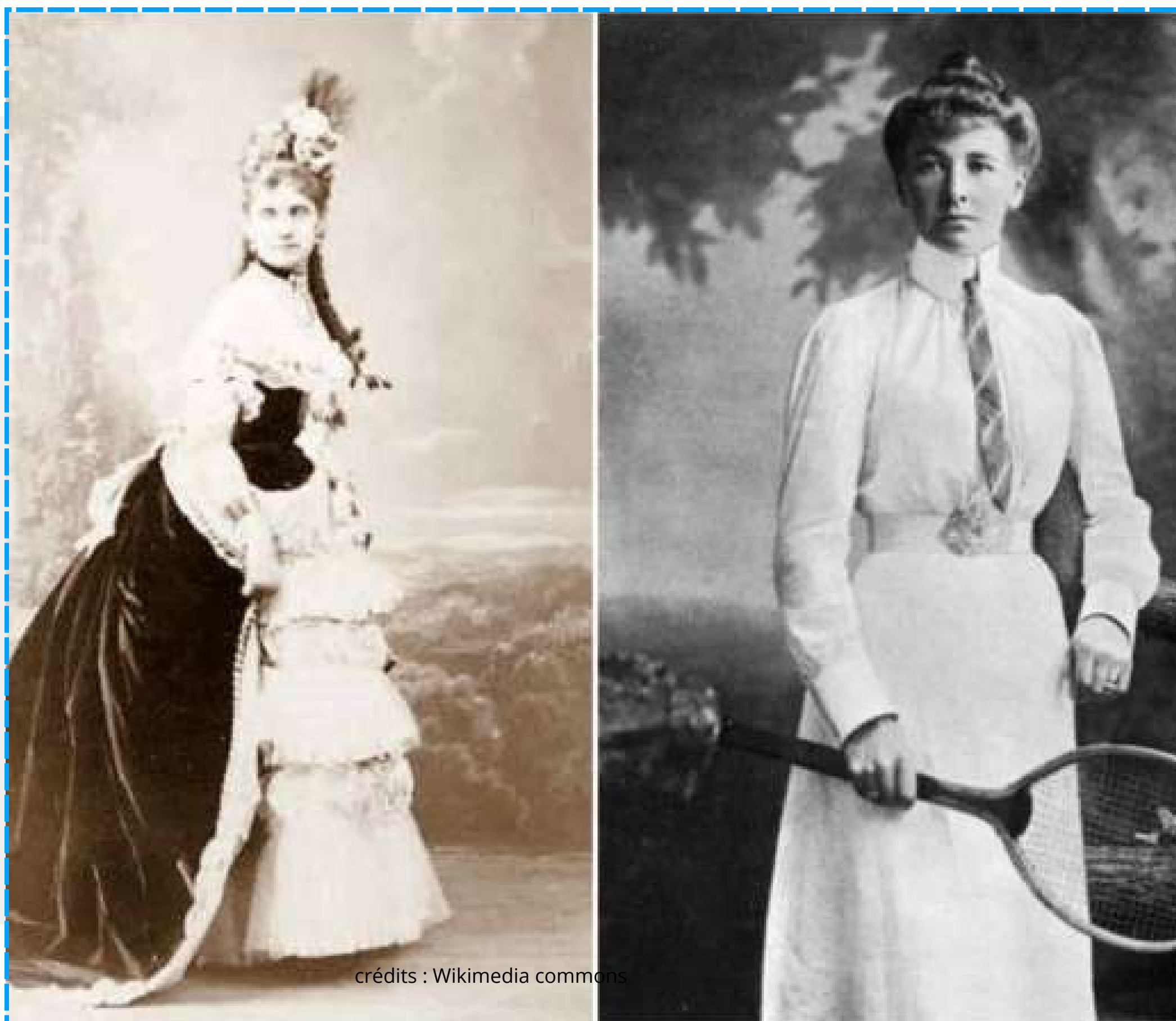
Hélène de Pourtalès et Charlotte Cooper font partie des premières athlètes ayant participé et remporté une médaille olympique, en 1900.

Dans le sport européen, on note une sous-représentation des femmes dans les postes à responsabilités, à la tête des clubs ou des fédérations, dans l'encadrement et le management amateur ou professionnel.